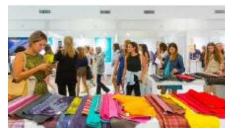
Rassegna Lineapelle oggi a Londra

Lineapelle apre la stagione autunno/inverno 2025/2026 del suo network internazionale con gli eventi di Londra (oggi) e New York (17-18 luglio), appuntamenti fissi per la sua «community» globale in vista dell'edizione di Milano (Fiera Milano Rho, 17-19 settembre). Londra accoglierà 42 espositori di cui 26 italiani: 25 le conterie (di cui 16 italiane), 8 produttori di tessuti e sintetici, 9 accessoristi. Filo conduttore «l'IA potrebbe migliorare la vita, ma il cuore fa la differenza».