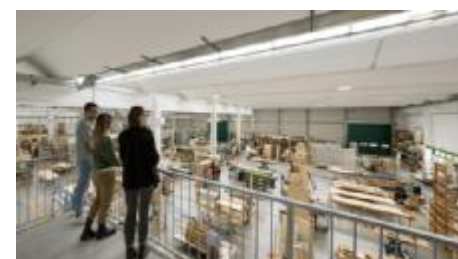
Valdagno La nuova sede di Zordan

Riparte l'Accademia Zordan di Valdagno, programma estivo rivolto ai giovani desiderosi di immergersi nel mondo del lavoro prima di aver concluso il percorso scolastico. Quest'anno Zordan ha come partner l'agenzia per il lavoro Umana. I partecipanti avranno l'opportunità di lavorare insieme al personale esperto e di prendere parte a sessioni formative gratuite, finanziate da Umana tramite il fondo Forma.Temp. L'ultimo turno, dal 26 agosto al 27 settembre, è rivolto ai maggiorenni.