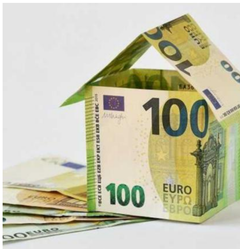
Mutui casi Le richieste in Veneto sono cresciute del +19% nei primi 6 mesi 2024

«Il 2023 è stato un anno complesso per il mercato dei mutui, colpito dall'aumento dei tassi di interesse e da una minore disponibilità economica da parte delle famiglie, già alle prese con l'aumento dell'inflazione - spiegano gli esperti -. Il 2024, però, è partito in modo positivo, con una richiesta in aumento, trainata soprattutto dal miglioramento delle condizioni offerte dalle banche per i