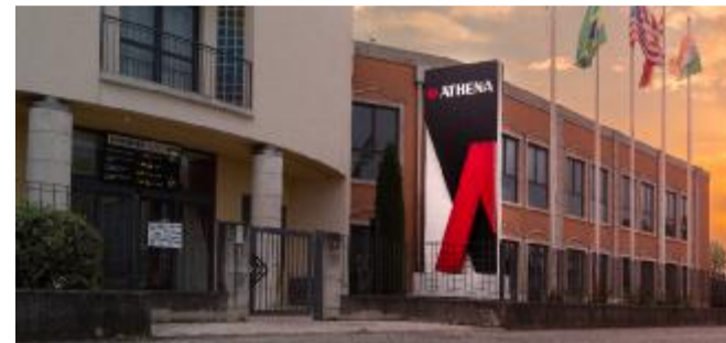
Uno scorcio dello stabilimento Athena ad Alonte