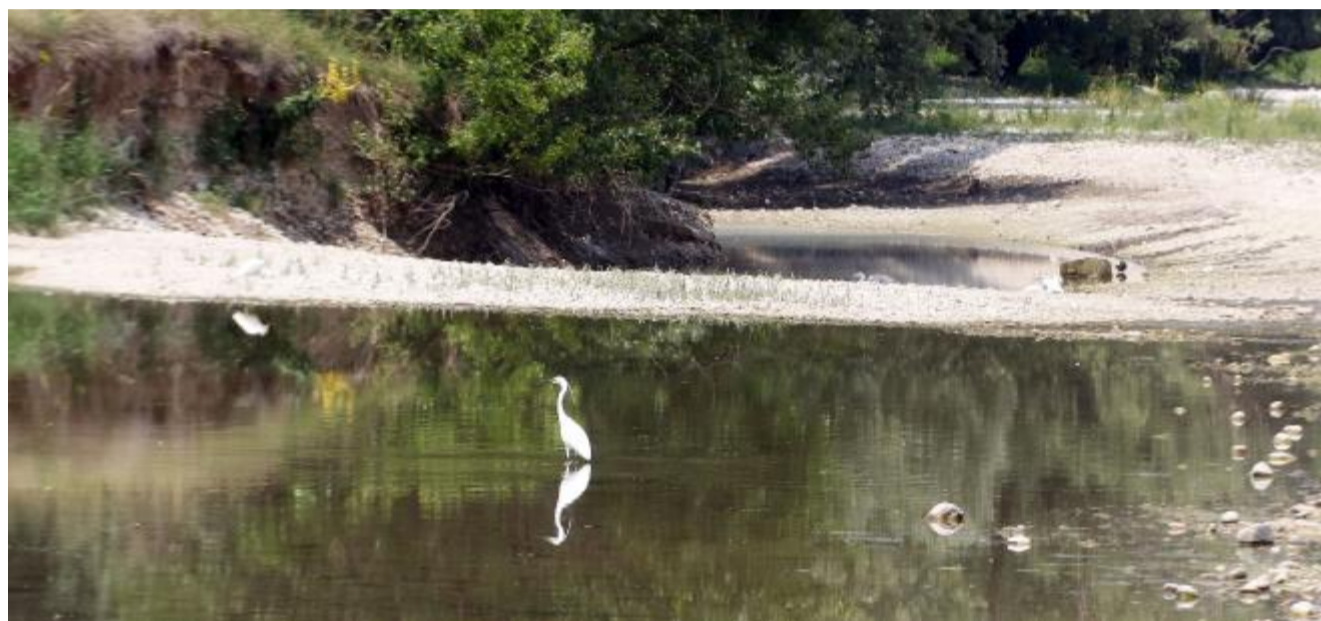
La grande sete Un'immagine del letto del torrente Astico in secca. È emergenza per i corsi d'acqua vicentini.

DOPPIO FEMMINICIDIO La cerimonia a Vicenza, la sepoltura a Schio