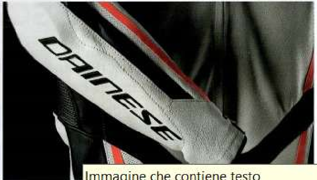
Immagine che contiene testo